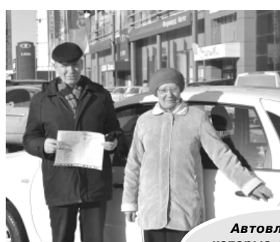
Автовладельцы, которые купили LADA в автосалоне «Форвард-Авто»

1 вариант: При стоимости автомобиля – 281 600,00* рублей и сроке кредитования 3 года (процентная ставка – 9,6%), первоначальный взнос составит 56 320,00 рублей (20% от стоимости авто).